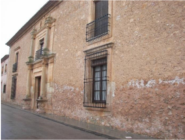
(2) Fachada. Año 2010