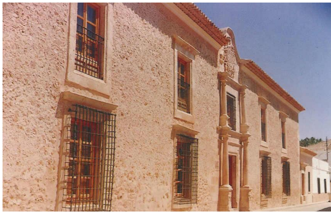
(2) Fachada. Año 2010