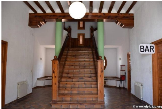
(4) Interior de la planta baja. Año 2020