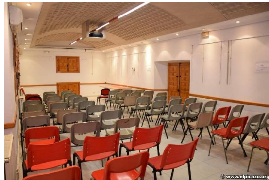
(5) Interior primera planta. Año 2020