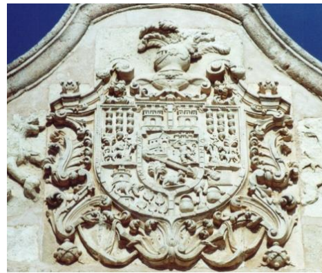
(3) Escudo de la familia Villanueva