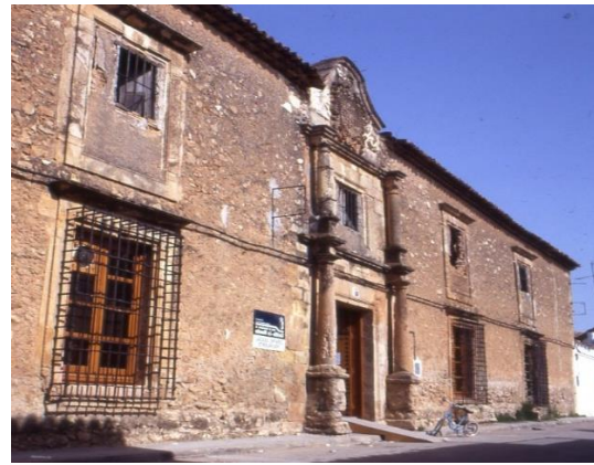
(1) Fachada. Año 2003-2005