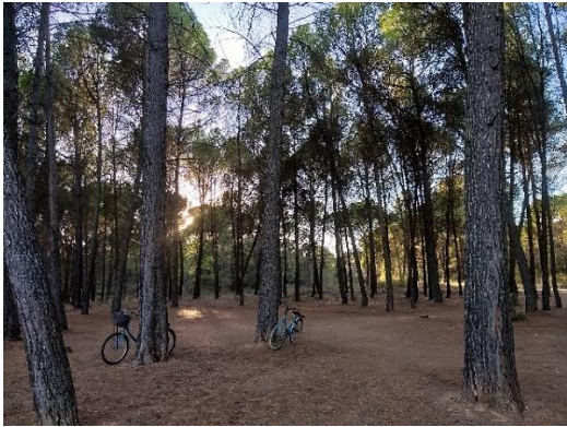
(4) Rincón del Pescador. Año 2019