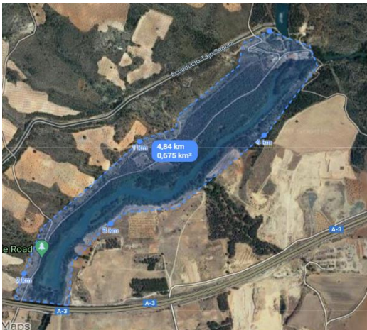
Superficie del paisaje de La Obra