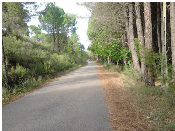
(1) Camino de La Obra. Año 2013