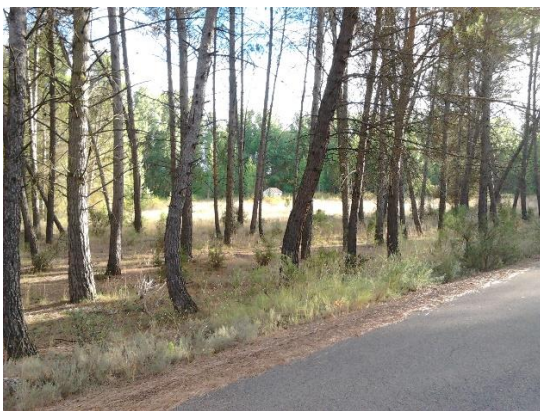
(2) Camino de La Obra. Año 2013