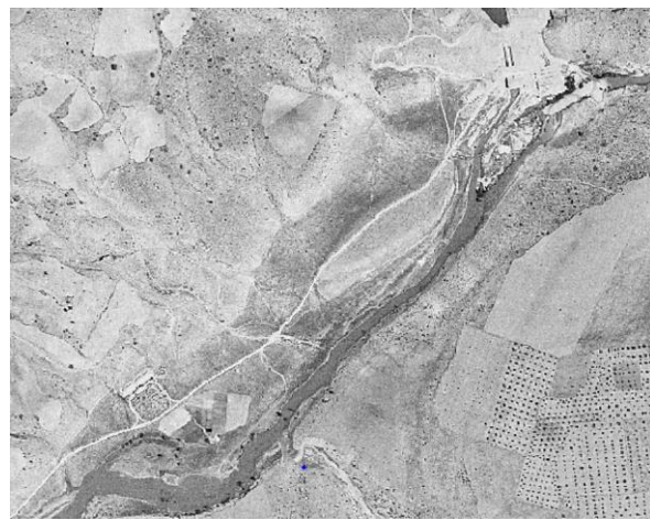
(7) Imagen aérea del paisaje de La Obra. Años 1956-1957