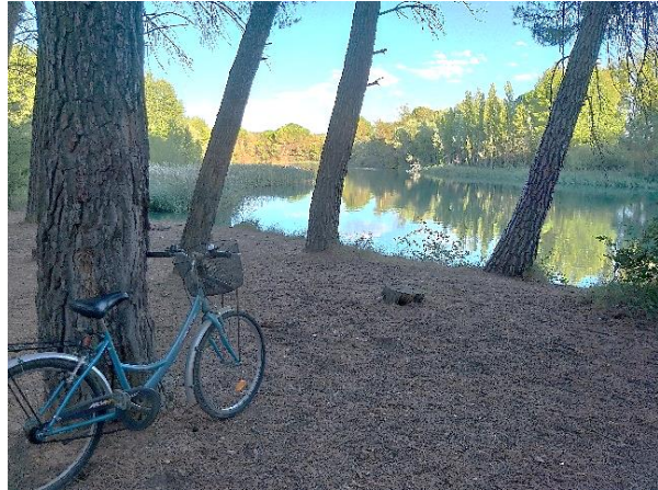
(5) Rincón del Pescador y contraembalse de Castillejos. Año 2019