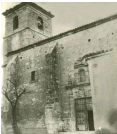
(2) Fachada sur. Ca. 1940-1950