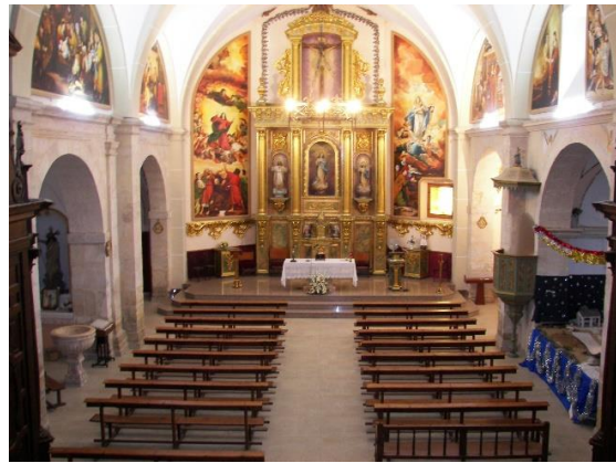
(5) Interior. Años 2007-2008