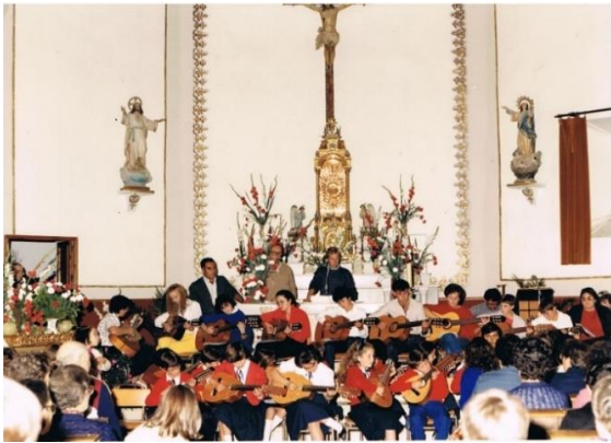
(4) Altar Mayor. Ca. 1980