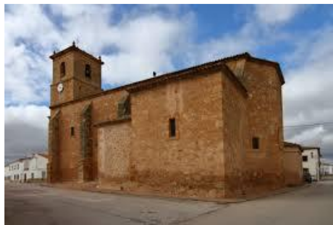
(3) Fachada Sur. Año 2010-2011