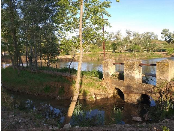
(6) Presa y compuertas. Año 2020