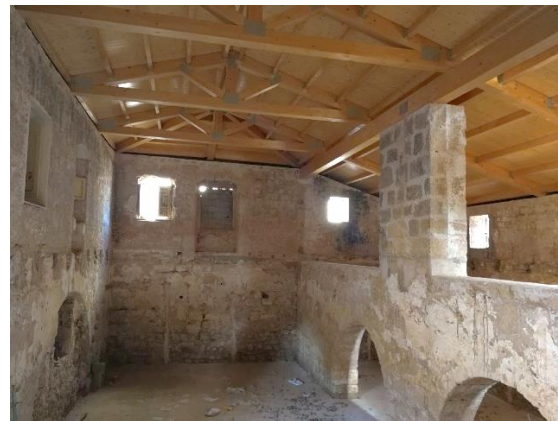
(3) Interior. Años 2015-2016