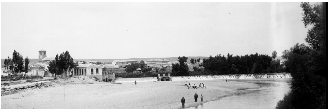
(7) Central hidroeléctrica y presa. Años 1950-55