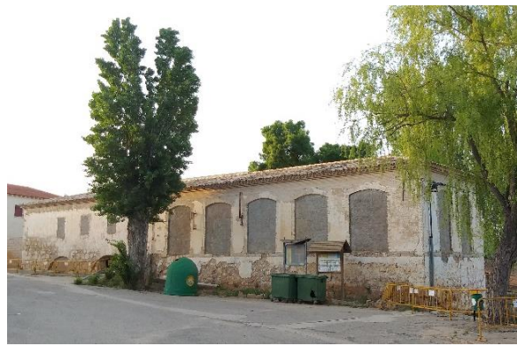
(1) Fachada Sur. Año 2020