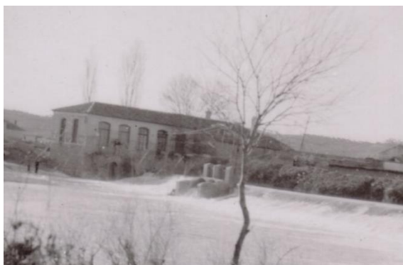
(4) Central hidroeléctrica. Año 1950