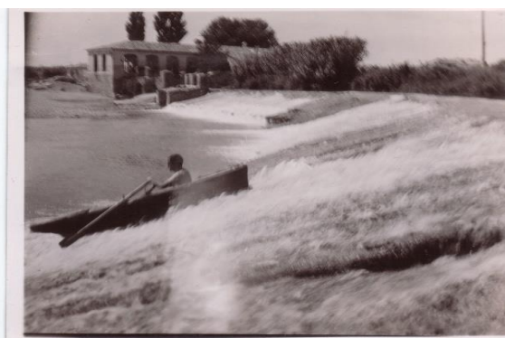
(5) Presa. Año 1950