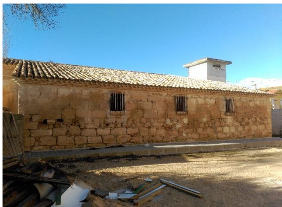
(2) Fachada norte. Años 2015 -2016