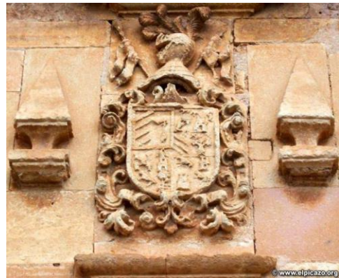
(3) Escudo familia Ruíz de Monsalve