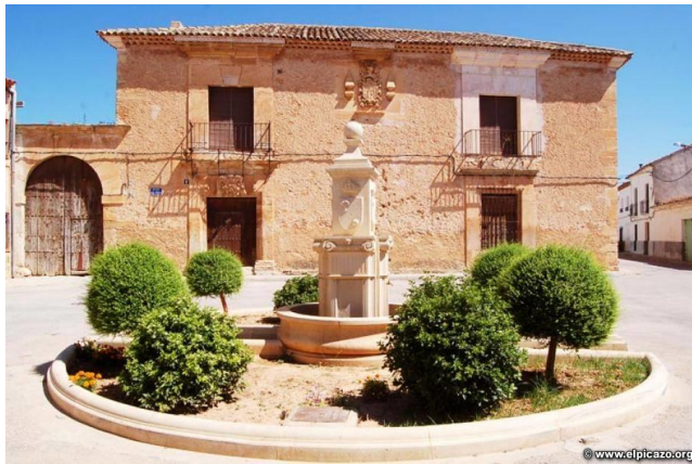
(2) Fachada principla. Año 2010