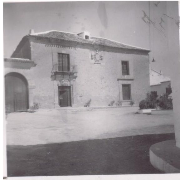
(1) Fachada y Plaza Mayor. Año 1962